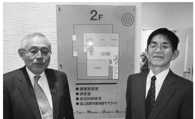
富山国際学園南砺サテライト前にて