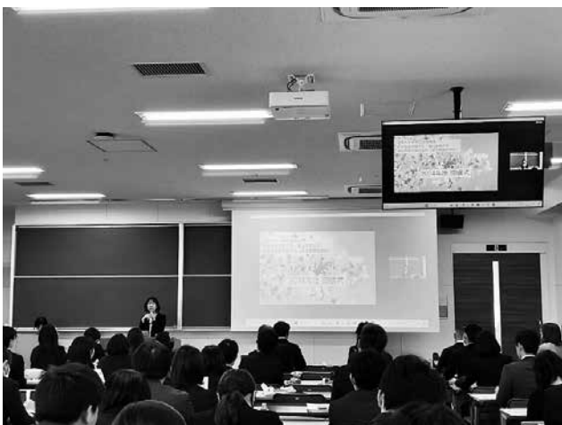
2024(令和6)年4月6日(土)の入学式後の開講式の様子